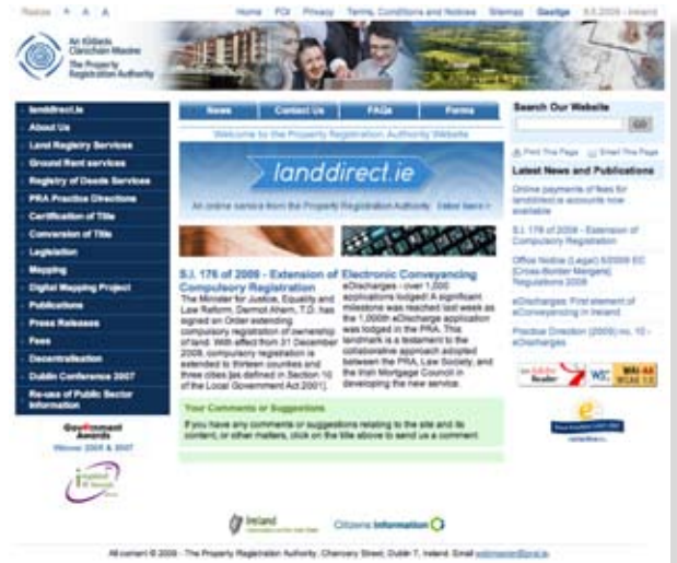
PRA website was redesigned and upgraded.