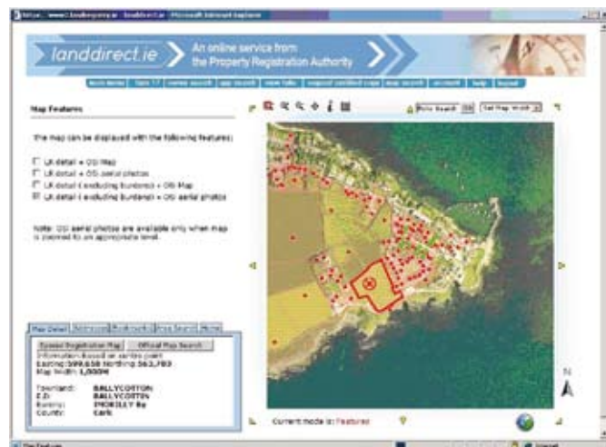
Mapa Digiteach ÚCM ag léiriú clárúchán forleagtha ar fhótagraif SoÉ

De thoradh Thionscadal na Mapála Digtí, forbraíodh an áirithe sin seirbhísí nua i rith 2008 ina measc an Mapa Cláraithe Speisialta agus áis leictreonach Cuardaigh Ceantair. Tá beartaithe a thuilleadh sínte a dhéanamh ar raon na seirbhísí atá á soláthar ag úsáid sonraí na mapála digítí in 2009.