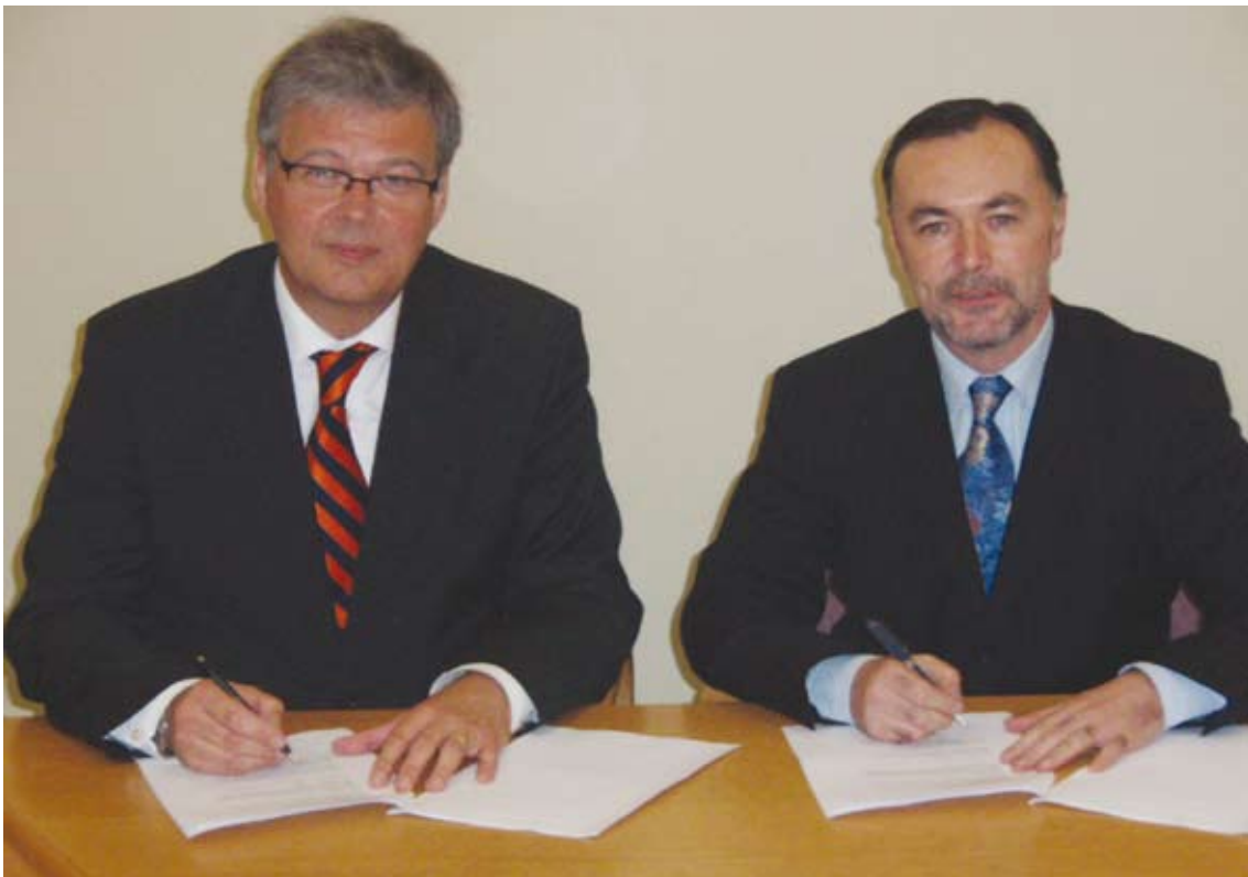
Gabhann ÚCM isteach in EULIS go foirmeálta

Chuaigh an tÚdarás Clárúcháin Maoine isteach in EULIS go foirmeálta ar an 21ú Samhain 2006. Tosófar ar an obair theicniúil le seirbhísí ar-líne an Údaráis a chur ar fáil do bhalltíortha eile EULIS go luath i 2007. Meastar don Údarás go mbeifear i riocht seirbhísí beo a thairiscint trí thairseach EULIS www.eulis.org sa chéad leath de 2007.